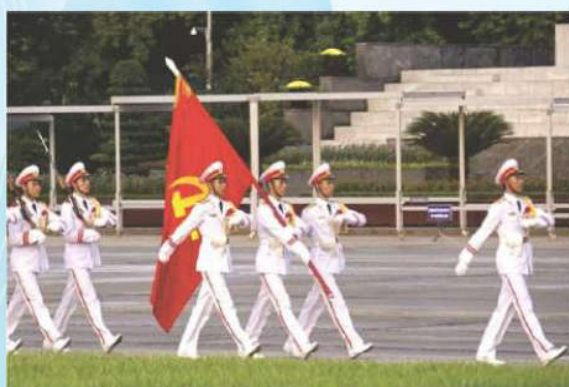
Hình 23c (vác cờ)