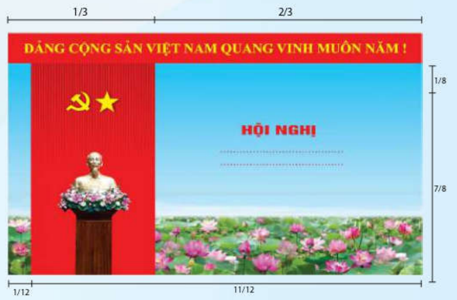
Hình 5a (cờ xếp dọc)