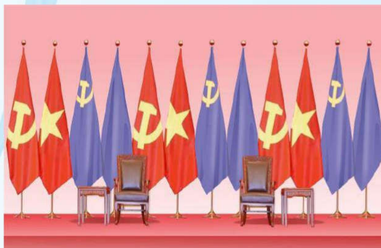
Hình 22 - (2 cờ màu tím là minh họa cờ Đảng và Quốc kỳ nước khách)

Điều 12. Nơi tổ chức các hoạt động đối ngoại đảng, ngoại giao nhà nước