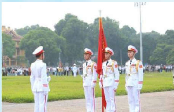
Hình 23a (cầm cờ)