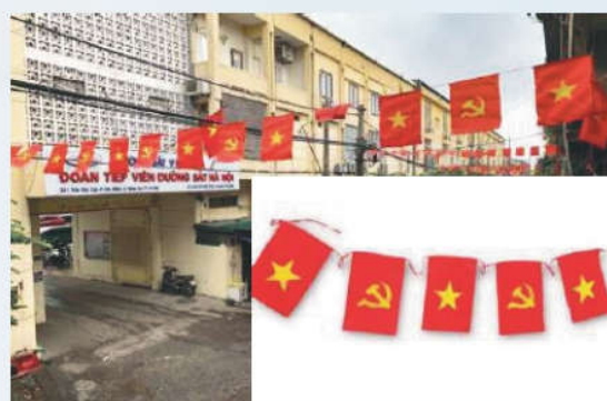
Hình 16b (cờ dây)