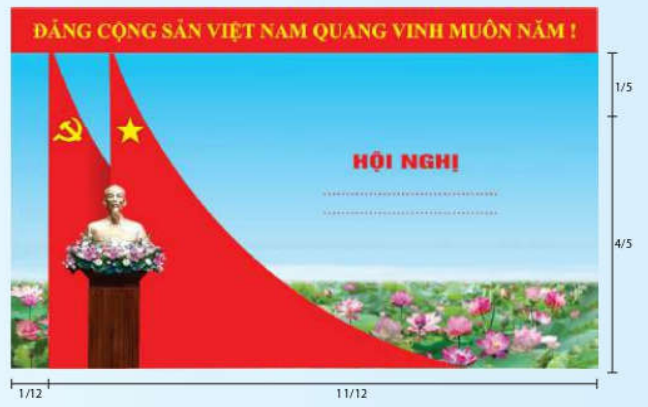
Hình 5c (cờ xếp chéo đôi)