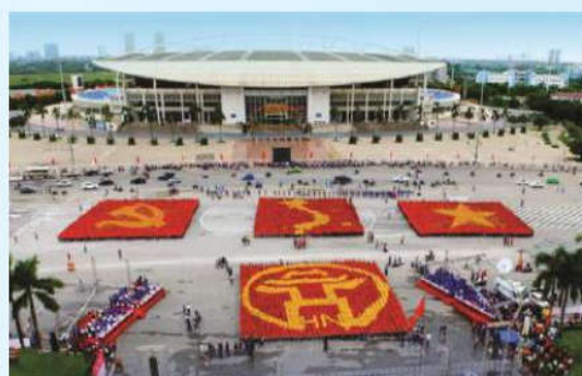
Hình 32 (xếp bằng người)