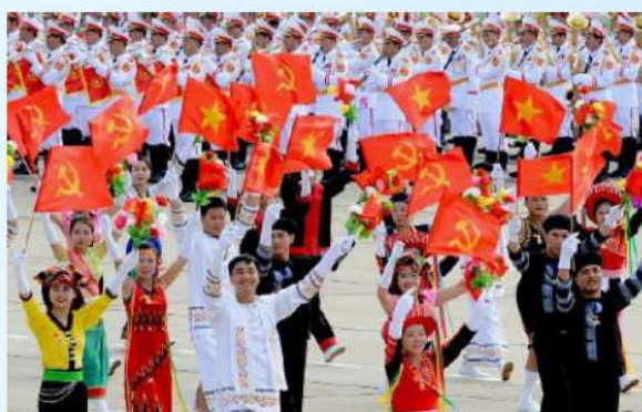
Hình 23d (vẫy bằng tay)