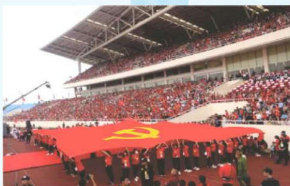
Hình 24a (rước cờ vai)