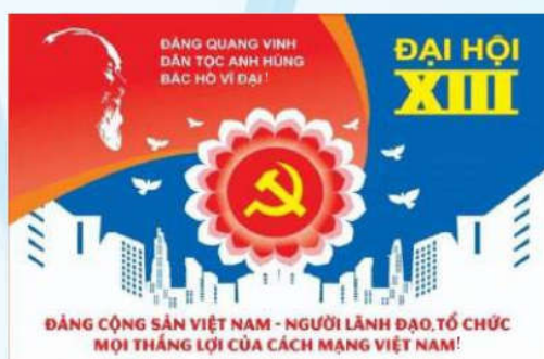
Hình 31b (panô tuyên truyền)