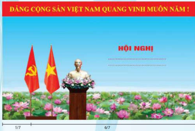
Hình 2 (Cờ có cán)