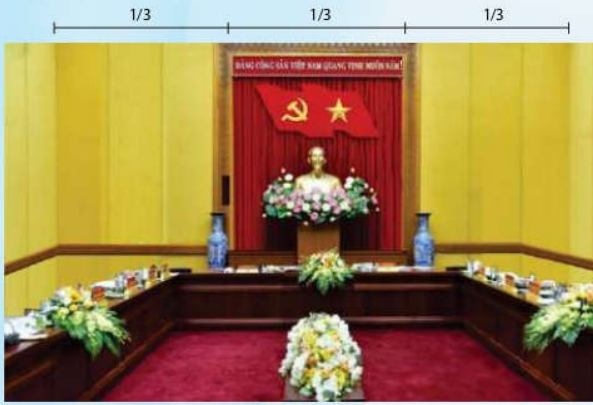
Hình 4b (kích thước hội trường nhỏ)