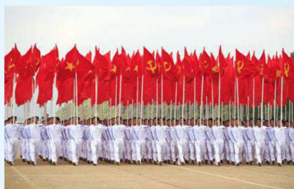
Hình 24b (rước theo hàng)