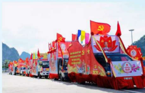
Hình 24d (rước bằng xe)