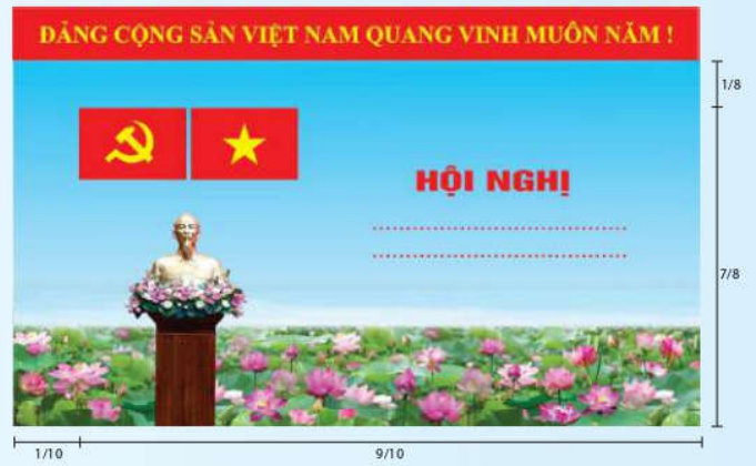
Hình 3a (cờ không tạo sóng)