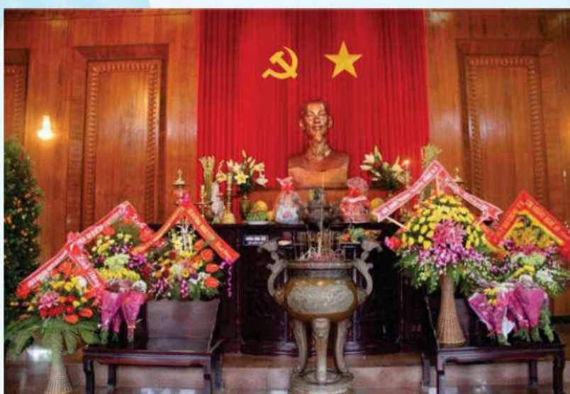
Hình 21c - Trong đền thờ chính

Điều 12. Nơi tổ chức các hoạt động đối ngoại đảng, ngoại giao nhà nước