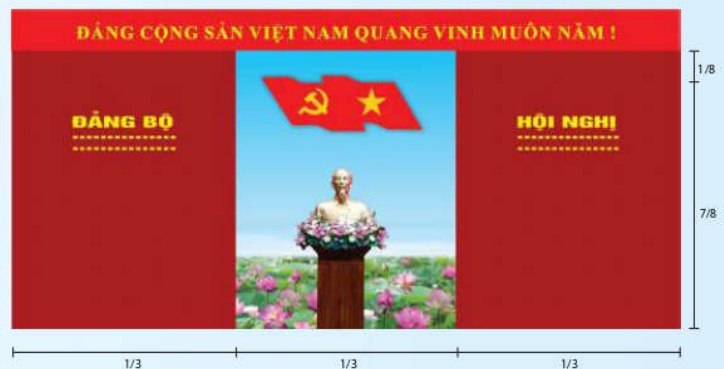
Hình 4a (kích thước hội trường rộng)