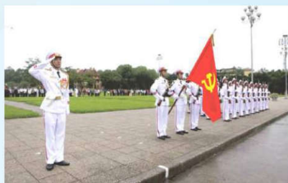
Hình 23b (giương cờ)