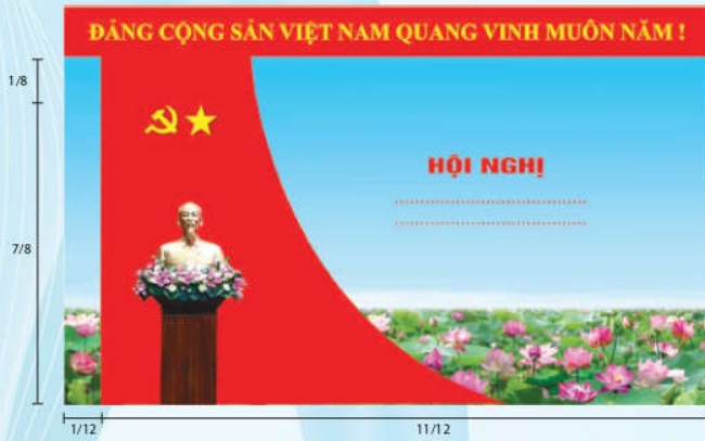
Hình 5b (cờ xếp chéo đơn)